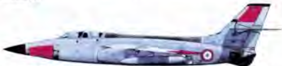
Le Vautour II N° 337 immatriculé F-ZADN (1972) équipé d'un nez Cyrano IV et de sièges éjectables Martin Baker Mk4. Large surfaces day-glo sur l'avant du fuselage, le sommet de la dérive, les extrémités des ailes (mais pas les volets) et les bidons

Au mois d'avril 1969, lorsque le bimoteur se voit greffer une coque radar de Cyrano IV, les marquages restent inchangés.