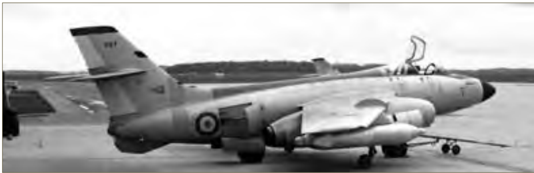
Insigne de l'EM 85 Loire encore visible, le VIIN 307 lors de l'expérimentation de bidons de CME.

This VIIN took its part in testing ECM pods.