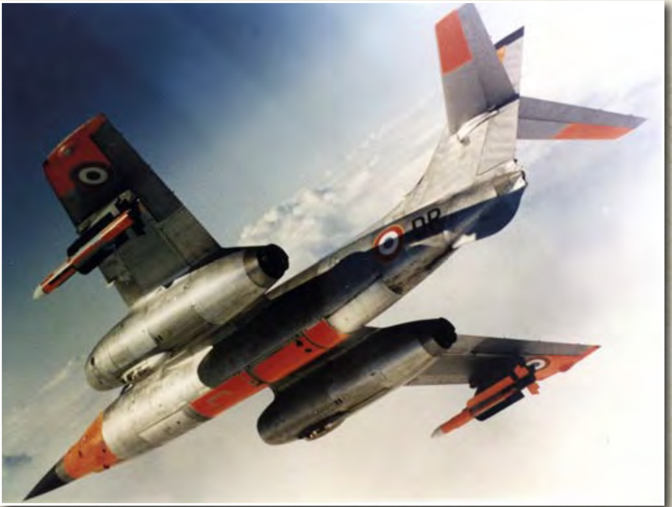
Essais du Super 530 par le VIIN n° 304.