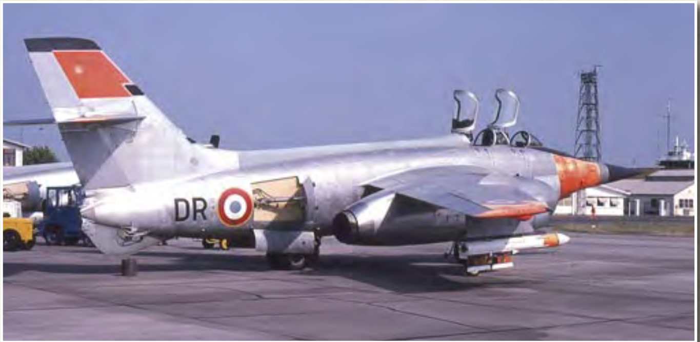
L'appareil sert de banc d'essais volant pour missiles et radars en cours de développement.