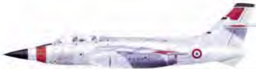
Le SO-4050 Vautour II N n°337 équipé d'un nez Cyrano IV avec bandes anticollisions fluorescentes (1975)

A l'issue de son chantier d'installation du radar RDM destiné aux Mirage 2000 C/B, en 1979, le Vautour reçoit sa dernière livrée tricolore, bleu-blanc-rouge, qu'il gardera jusqu'à son retrait du service, en janvier 1988.