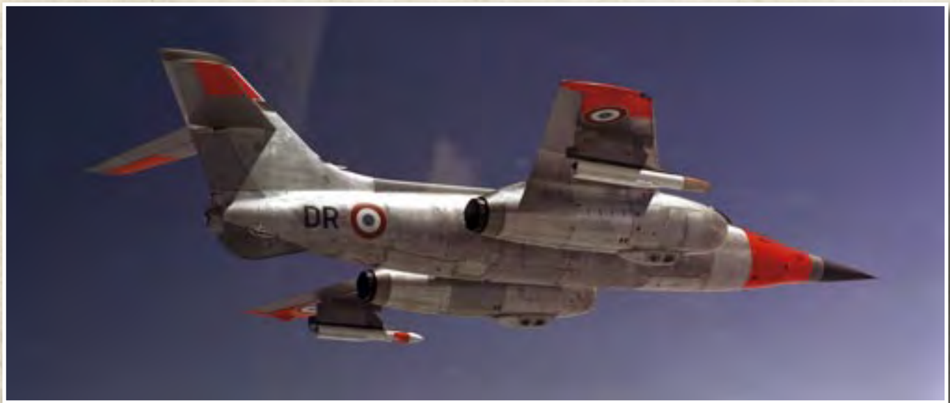
Le VIIN n° 304 en configuration lisse entre périodes d'expérimentation.