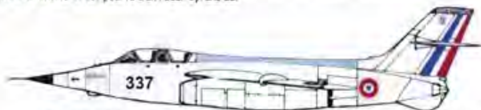
Le Vautour II N° 337 équipé d'un nez Cyrano II et de sièges éjectables Snooco E-96 (1962)

En avril 1962, l'appareil est revêtu d'une peinture grise anticorrosion, voit ses canons démontés et est pourvu d'un radar Cyrano II.