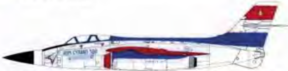
Le Vautour II N n° 337 équipé d'un nez RDM avec sa livrée tricolore, bleu-blanc-rouge (1980 - 1988)

De chaque côté de la pointe avant, figurent le logo, en couleur, du CEV et le sigle "Thomson CSF RDM 500" et, de part et d'autre de la dérive, l'emblème de l'Atelier Industriel de l'Air (AIA) de Clermont-Ferrand. En forme d'aile delta, ce logo, rassemblant les trois lettres de l'établissement (A.I.A.), est le seul jamais arboré par un Vautour II N. Les traditionnelles cocardes tricolores subsistent aux extrémités d'ailes, intrados et extrados, mais disparaissent à l'arrière du fuselage.