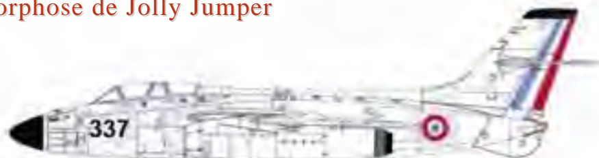
Le Vautour II N° 337 (Mai 1959)

En haut de la dérive figurait le sigle du constructeur, SNCASO, le gouvernail de direction recevant le drapeau tricolore. Les traditionnelles cocardes tricolores étaient apposées aux extrémités d'ailes, intrados et extrados, ainsi qu'à l'arrière du fuselage, derrière les aérofreins. A noter que l'appareil était équipé de ses quatre canons de 30 mm.