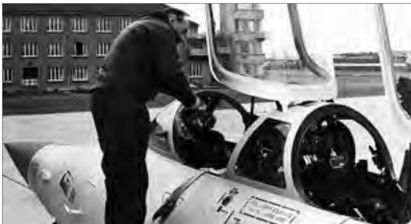
Le n° 337 (F-ZADN) en place à l'annexe CEV de Cazaux. CEV

This aircraft left the Saint Nazaire plant on 29 April 1959 and was directly assigned to the CEV to take part in the Cyrano radar experimentation.