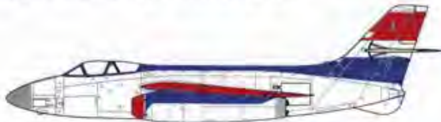
Le Vautour II N n° 337 tel qu'exposé aujourd'hui avec son nez d'origine mais sans ses quatre canons de 30 mm

Peu après son arrivée au musée Safran de Melun-Villaroche, le SO-4050 Vautour II N n°337, alias "Jolly Jumper", toujours aux couleurs du CEV diffère de sa précédente configuration par la remise en place du radôme d'origine et l'effacement du sigle "Thomson CSF RDM 500".