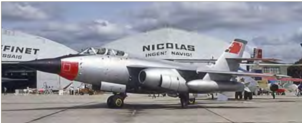
Un nez redessiné pour loger le Radar Doppler à Impulsion du Mirage 2000.

This VIIN took its part in testing ECM pods.