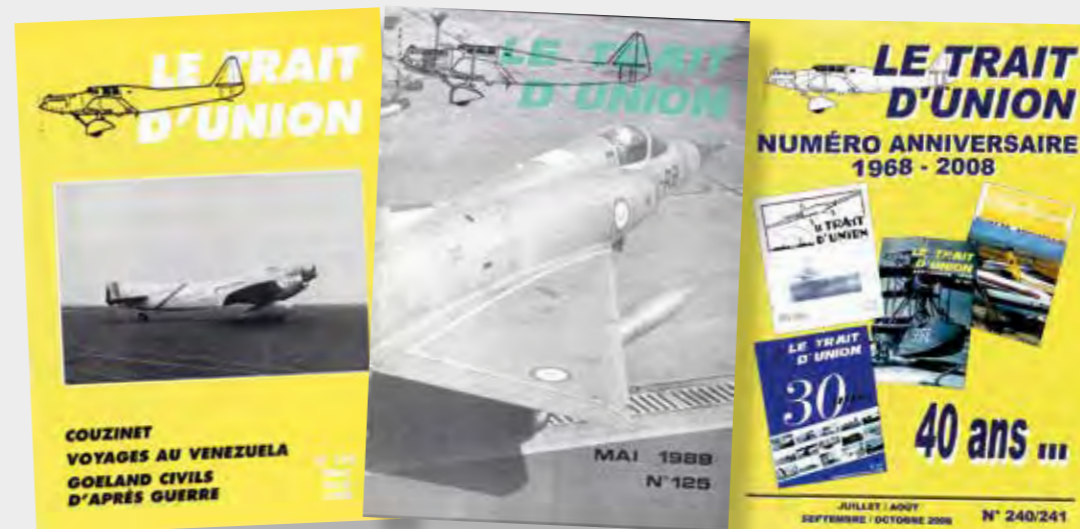
Clé usb disponible sur le site de l'ABFAB : www.bfab-tu.fr